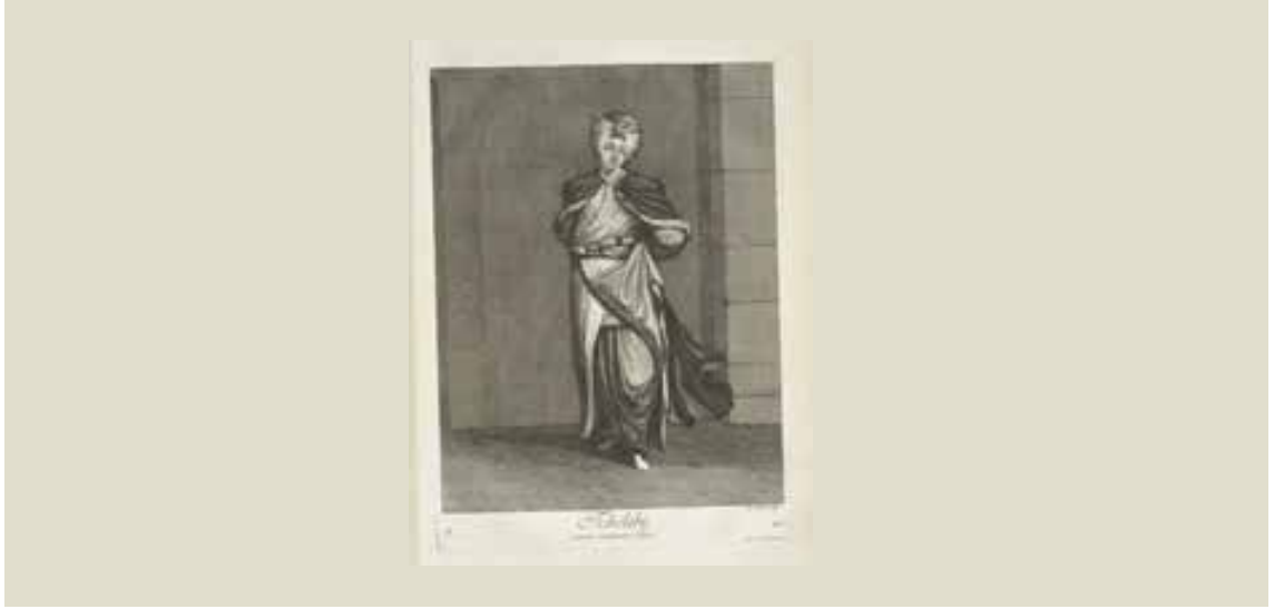
Görsel 3, Jean-Baptiste Van Mour (1671-1737) İstanbul Şehzade,

Sanatçı eser üretim aşamasında, bir tür varlık sorunsalının ötesinde kendine ait olanı, içselleştirdiği şeyleri görünümlere dönüştürmektedir. İki boyutlu yüzeyde üç boyutlu oluşan bu yansımalar boyar ve çizer malzeme ile duvar, kağıt, tuval, plakalar gibi yüzeylerde resim olarak izleyen ile buluşmaktadır. Elbette değişen teknikler resmin görünüm ve anlamını etkilemekte, değiştirmektedir. Aynı zamanda her teknik ifade bakımından sanatçının tercihi olduğundan sanatçının yorumu ile değişmekte ve gelişmektedir. Kendini ifade etmek için her sanatçı farklı tekniği kendine yakın bulur, uygular ve geliştirir. Anlam ve ifade zenginliği yaratan bu uygulamalar yaratıcı sanat çalışmaları olarak nitelenirler.