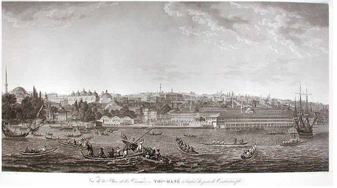
Görsel 2, Antonie Ignace Melling, Top-Hane, İstanbul, Gravür