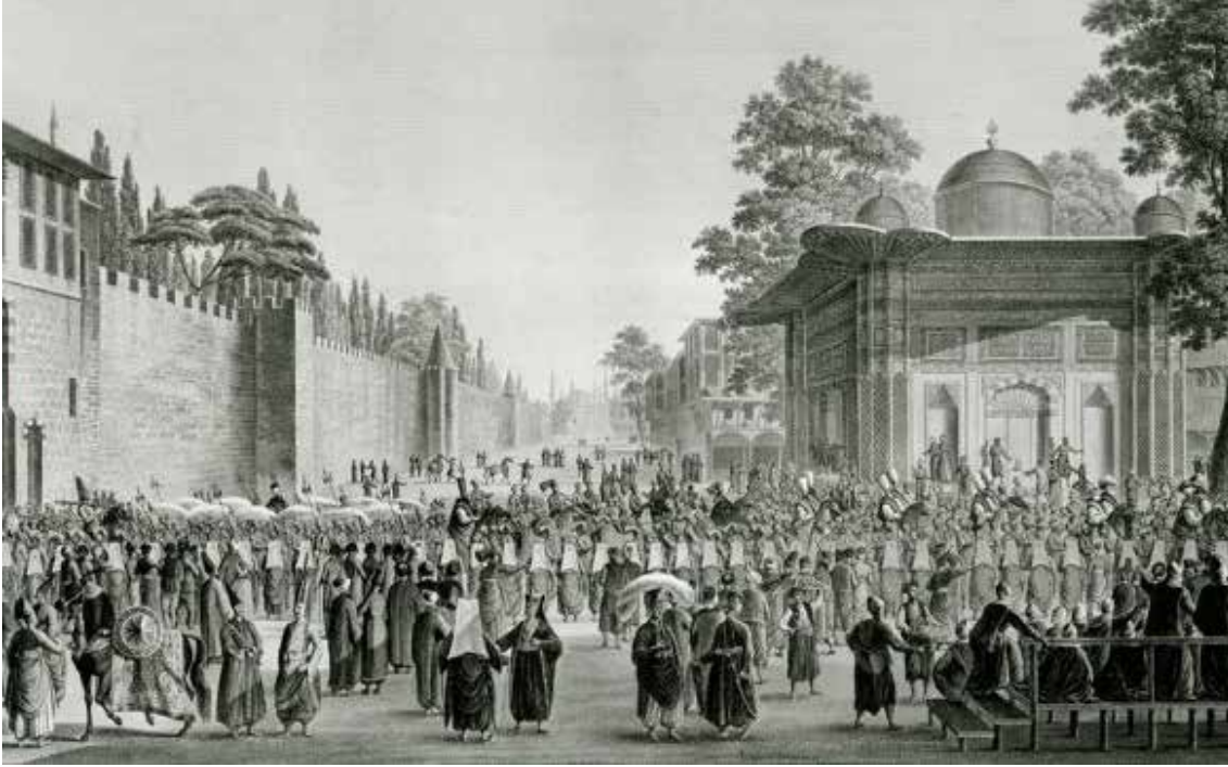
Görsel 1, Antonie Ignace Melling, İstanbul gravürlerinden "Sultanın Bayram Alayı" isimli gravür; Sultan III. Ahmed Çeşme'si ve Topkapı Sarayı Bab'u Humayun'un önü

İnsanoğlu mağara döneminden beri doğayı anlamaya ve taklit etmeye çalışır. Bu bazen bilinçli bazen de bilinçsiz bir süreçtir. Bu taklit aşaması aslında uyum sağlama çabasının ötesinde, anlamak ve hayatta kalmak için çözüm üretme zorunluluğudur. Bu çözüm üretme çabası insanoğlunun eline aldığı malzemeyi ihtiyaçları için şekillendirmesini ve dönüştürmesini sağlamıştır. Üretim nesnelere varlığı, yaşamın sürekliliğinde ve kalitesinde insanın aşama kaydetmesini sağlamıştır. Yaşamın sürekliliği için gerekli ve önemli olan bu süreç, çoğu zaman sanatsal ürünler ile görselleşmektedir. Yaşadığı mekanın duvarları, giysileri ve kap kaçaklar üzerine işlediği görseller de insanın ihtiyacından kaynaklıdır. Bu estetik ihtiyacın yanı sıra kullandığı, yaşamına giren her şeyin ilişki içerisinde olması güdüsüdür. Bu ürünler yapıldığı dönem için sanat ürünü olarak tanımlanmamış olsalar dahi, yapıldıkları kültüre ait olmaları nedeni ile sanat ürünleri olarak değer kazanmaktadır.