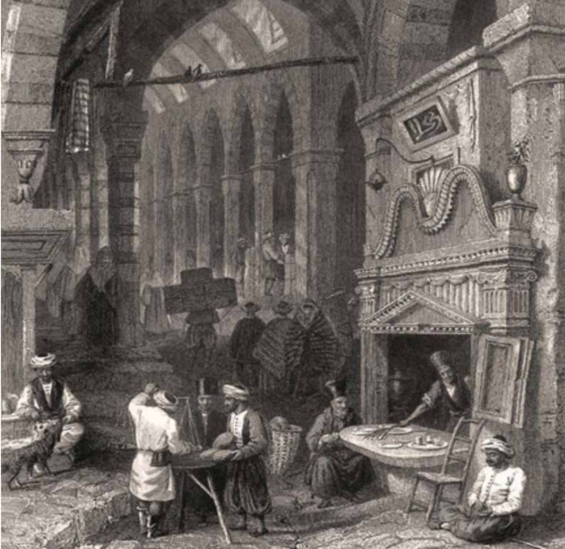
Görsel 4, William Henry Bartlett, Kapalı Çarşıda Kaymak Dükkanı,,Kaynak http://www.artytablo.com/urunler.aspx?id=295&Page=1 , 02.02.2016

1960 yılında Viyana III. Sanatçılar Kongresinde alınan beş kural ile belirlenen baskı resim baskı ve sanat eseri olarak kabul edilme kriterleri ise şöyledir: Gün içerisinde sanatçısı tarafından karar verilen sayıda basılan eser sanatçısı tarafından imzalanacak, numaralandırılacak ve kalıp imha edilecektir. Bu koşullar ile sanat çevresi baskı sayısı belirlenmiş olan baskı resmi sanat ürünü olarak kabul etmiştir.